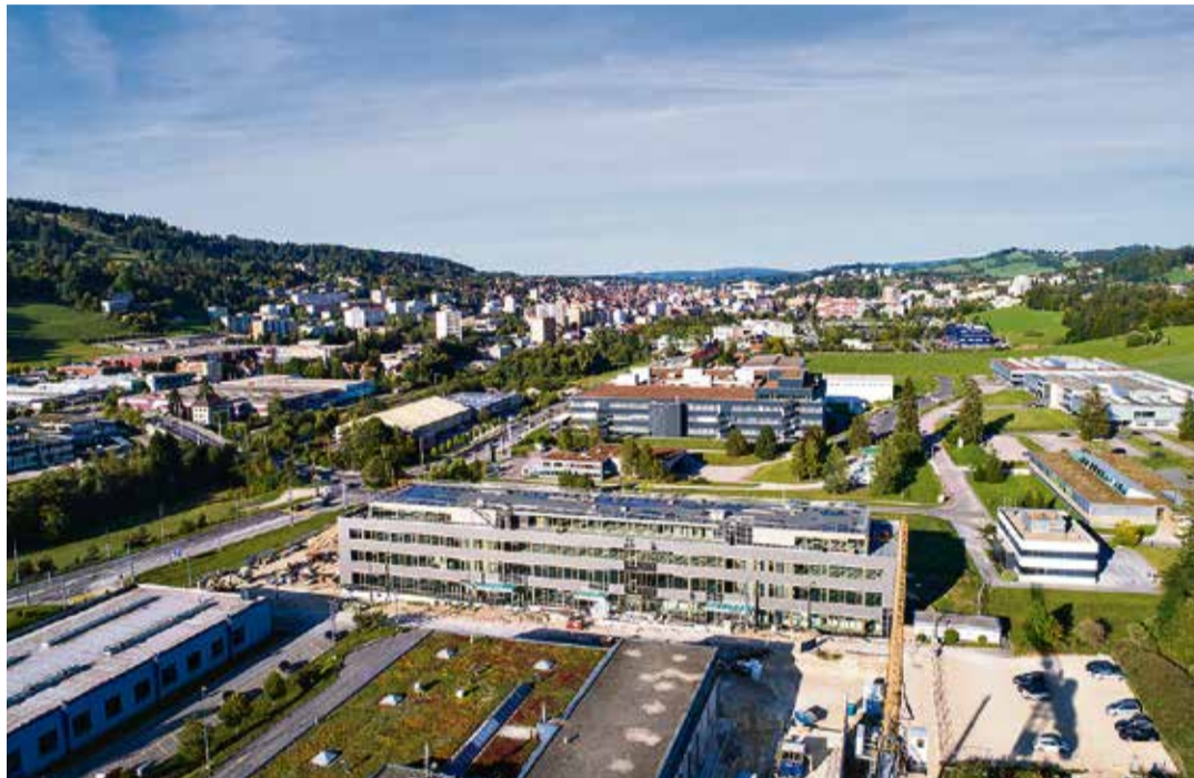
Le nouveau bâtiment, au premier plan, regroupant certaines des entreprises des «Industriels du Sentier» est situé à la sortie ouest de La Chaux-de-Fonds. Il est divisé à 35 millions de francs et sera opérationnel début 2018.